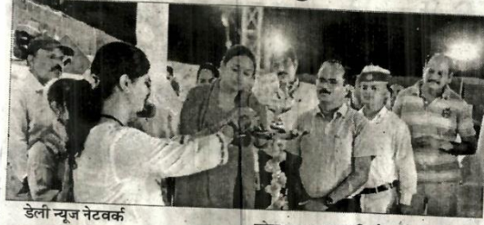
डेली न्यूज नेटवर्क

गाजीपुर। लोक सभा सामान्य निर्वाचन के दृष्टिगत जिले में स्वीय कार्यक्रम के अन्तर्गत 28 मई को सायं 6 बजे से लंका मैदान में 'चुनाव महोत्सव एक सांस्कृतिक संध्या' कार्यक्रम का आयोजन किया गया। जिला निर्वाचन अधिकारी